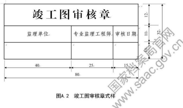
图A.2 竣工图审核章式样